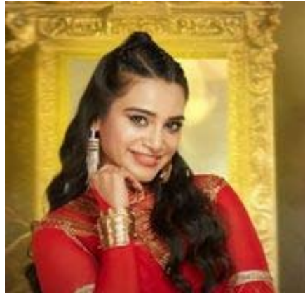
गेल्या काही दिवसांपासून ज्याची प्रेक्षक आतुरतेने वाट पाहत होते तो बिग बॉसचा